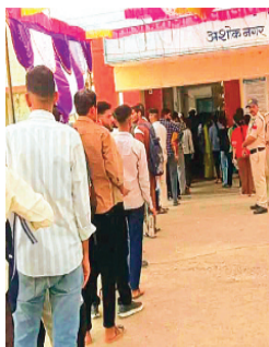
हरिभूमि न्यूज़ अशोकनगर

मध्यप्रदेश राज्य प्रशासनिक सेवा एवं राज्य वन सेवा परीक्षा रविवार को अशोकनगर जिला मुख्यालय के 3 केंद्रों पर आयोजित की गई। इस परीक्षा का आयोजन दो सत्रों में किया गया था, सुबह 10 बजे से प्रारंभ होने वाले सत्र में 212 परीक्षार्थी अनुपस्थित रहे और दोपहर 2 बजे से प्रारंभ होने वाले सत्र में 217 परीक्षार्थी अनुपस्थित रहे।