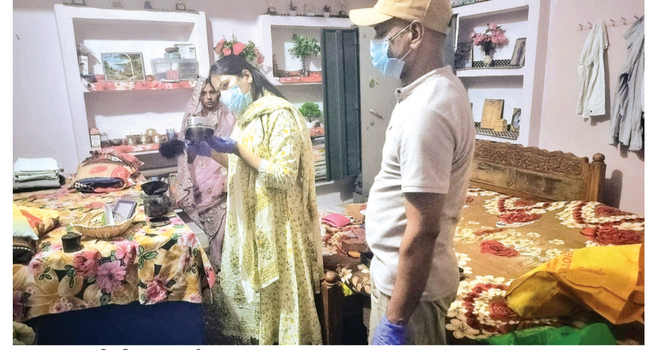
हरिभूमि न्यूज ▶ टीकमगढ़